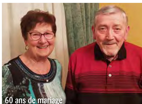
60 ans de mariage