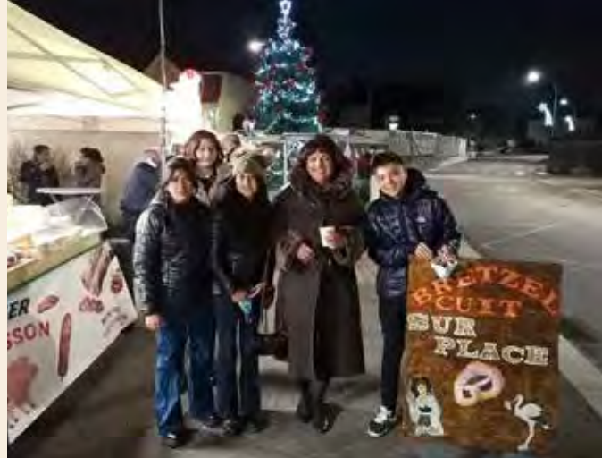
NB : Les masques, portés durant toute la visite, ont été retirés le temps de la prise du cliché.

C'est ainsi que cet événement mensuel, a soudainement pris, une dimension internationale et même transcontinentale !