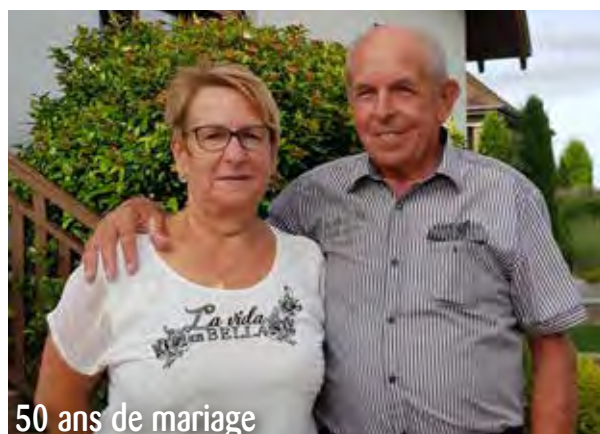
50 ans de mariage