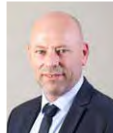
Vincent Thiébaud Député

Avec mon équipe, nous sommes à vos côtés.