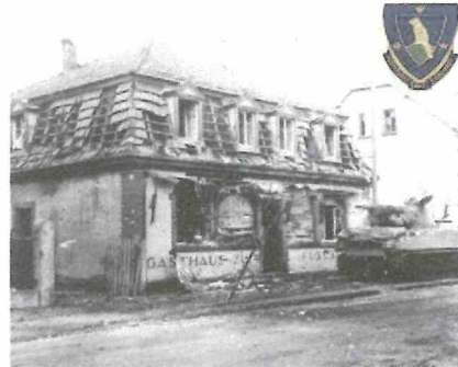
Un char Sherman route de Strasbourg à Haguenau au niveau du restaurant « Au Football » (Gasthaus Zum Fussball) La route étant supposée minée il avance sur le trottoir. Devant le même bâtiment 2 GI's du 314 e IR présentent leur « trophée »