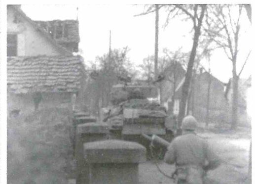
Progression de soldats américains du 314 e IR à l'entrée de Haguenau, route de Strasbourg, le 10 décembre 1944

Les jours suivants le régiment stoppe sa progression afin de préparer l'offensive sur Haguenau. Les combats se limitent à quelques escarmouches dans la forêt.