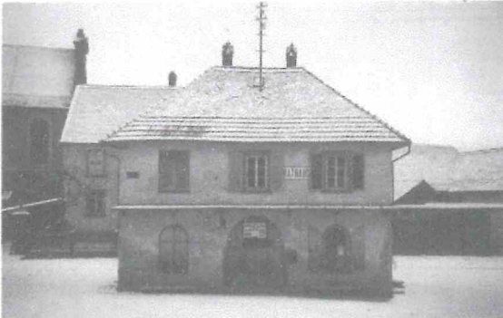
Le main de Niederschaeffolsheim, probablement sous l'occupation (entre 1940 et 1944). L'ancienne mairie et l'église (visible en fond) seront sévèrement touchés par les combats.

Le 27 novembre , les Allemands donnent l'ordre aux habitants d'évacuer le village en direction du Rhin, à Beinheim. L'ordre n'est que peu suivi, la plupart des habitants se réfugient dans les caves des maisons ou se retirent du côté de Ohlungen.