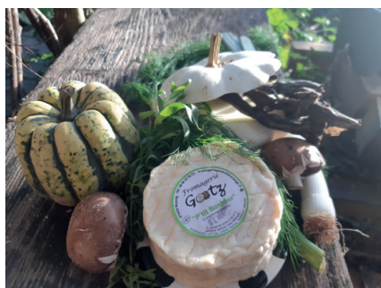
Ingrédients de la recette