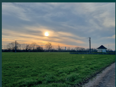
Zone de captages - Brumath

Les périmètres de protection rapprochée des captages de Mommenheim-Wlengersheim, Brumath et Bietlenheim ont la particularité d'être enherbés. Ces espaces agricoles apportent une protection efficace pour protéger les captages.