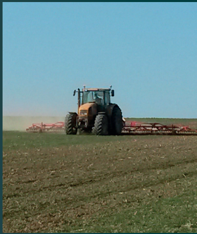
Désherbage mécanique d'un champ de blé

avec chaque exploitation candidate et ont permis de fixer des objectifs de réalisation pour 5 ans pour chaque indicateur.