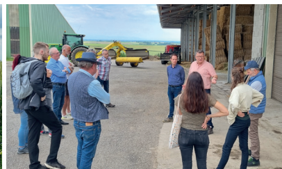
Visite GAEC du Faubourg - Minversheim